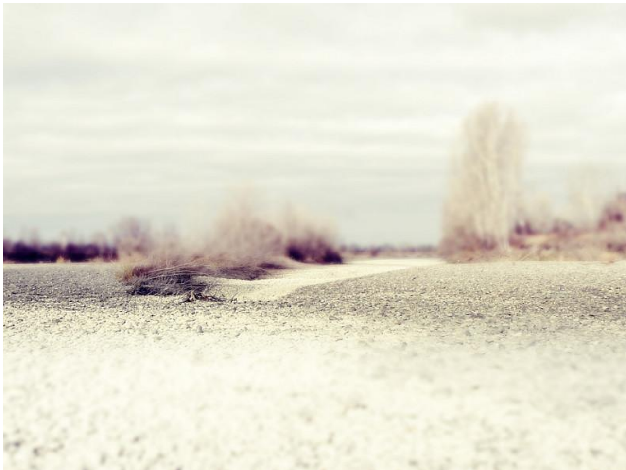
Долина Свободы - Горный Алтай р.Катунь

- Если человек не интересуется искусством, не начитан и.т.д... Он просто примат и животное. Ничто его от него не отличает. Разве что тупая жажда денег.