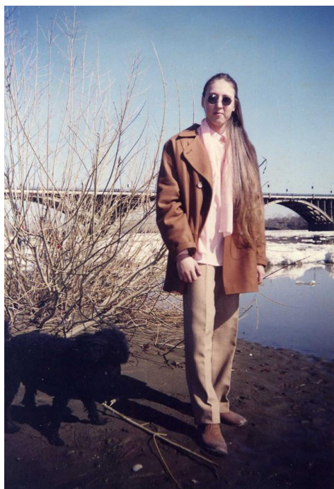
Ket Gun -Дочь писателя

Время 15:15 Давление 70Х50. Пульс 120. Пришли и уложили Маму. Дали настойку Золотого корня и завариваем кофе.