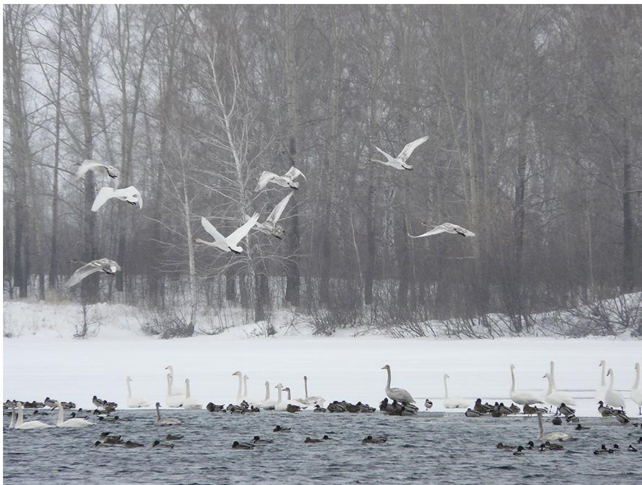
Дикие лебеди - Алтай